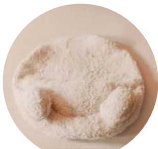
POSICIONADOR PARA PROP

Na fotografia Newborn, existem vários tipos e tamanhos de posicionadores. Quando eu iniciei, nunca tinha visto nada assim, as pessoas costumavam usar toalhinhas ou paninhos, e eu não usava nada.